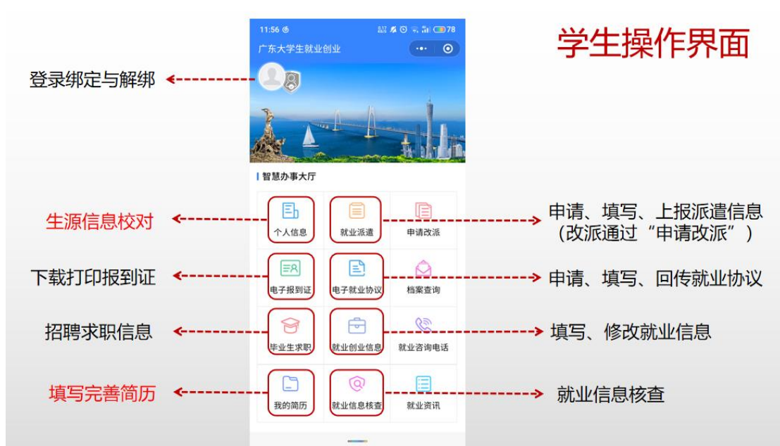
图 1 学生操作界面

步骤 4: 通过“我的简历”入口，填写完善简历信息，以便平台精准匹配并推送求职信息。详见附件 2《毕业生撰写提交电子简历操作流程》。